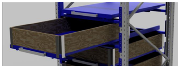
La tablette coulissante pour rehausse palette