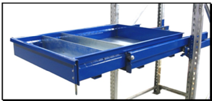
Le tiroir avec diviseurs (3 en version de base) Entre axe des encoches : 50 mm